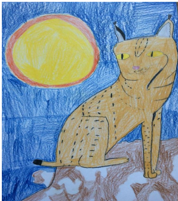
Šelmu nakreslila Tereza Galetková.

Dne 25. ledna byla strašlivá vichřice, která stále sílila a sílila. Zavátým lesem šel mladík, který byl promrzlý až na kost. Zvedl hlavu a v dálce uviděl malý dřevěný srub. V tom samém okamžiku uslyšel vytí vlků. Z posledních sil se rozběhl. Když doběhl ke dveřím, popadl za kliku a vrazil dovnitř. Vevnitř spali dva lovci. Lovci se probudili a poskytli mladíkovi kávu a malý kus pečiva. Přitom co jedl, se ho zeptali, před čím utíkal. On jim odpověděl: „Před vlky.“ Lovci říkali, že v noci musí být jeden na stráž, protože se vlci umí dobýt dovnitř.