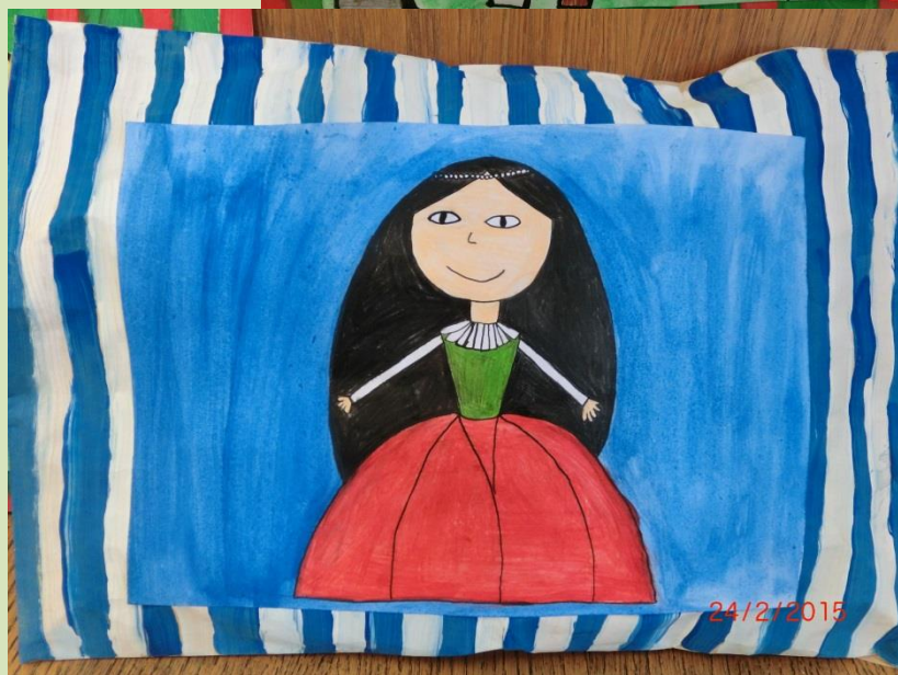
Obrázky namalovali žáci z 3. A.