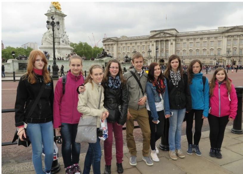
Část vizovické výpravy před Buckinghamským palácem