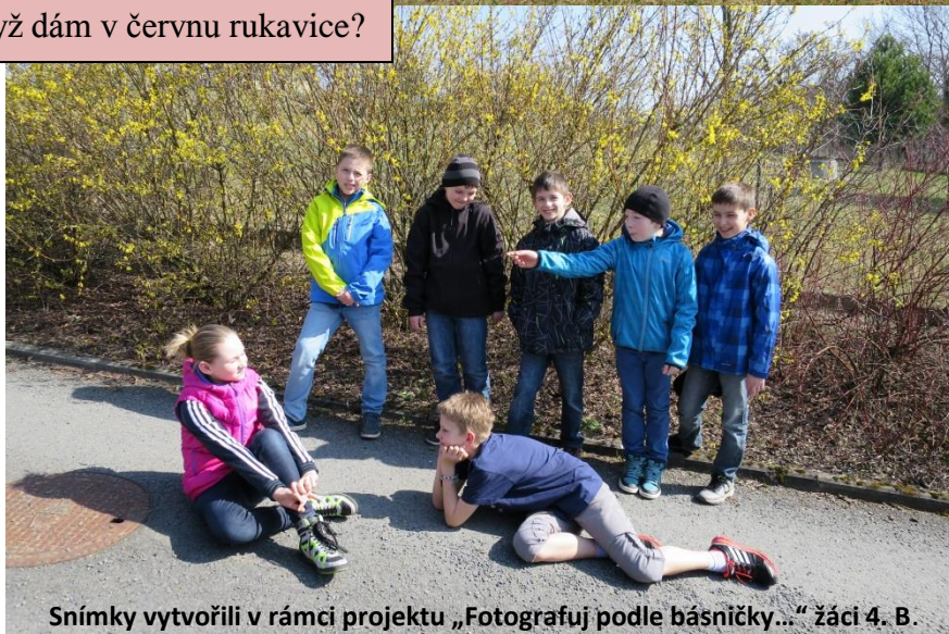
Snímky vytvořili v rámci projektu „Fotografuj podle básničky...“ žáci 4. B.